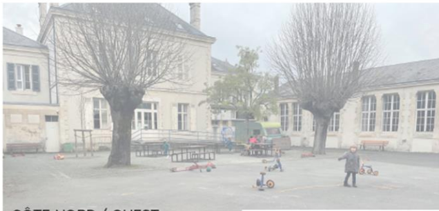
CÔTE NORD / OUEST