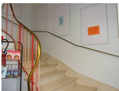
Réfection des peintures intérieures du CSC