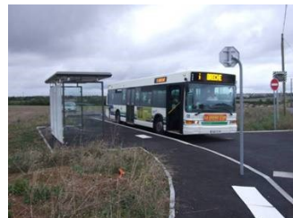
Aménagement d'une raquette de retournement des bus, rue de la Roussille