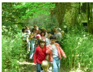
Projet Téciverdi (arbre à tricots et randonnée)

Après 6 demandes effectuées auprès des institutions (Mairie et Conseil Général) et restées sans suite et ne sachant plus à qui s'adresser, des représentants de l'Association des habitants de Buffevert sont venus sensibiliser le conseil sur des questions de sécurité dans le secteur du carrefour route de Nantes / Buffevert / Vallées de Buffevert.