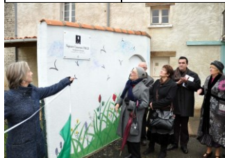
Dénomination du square « Laurent Page »