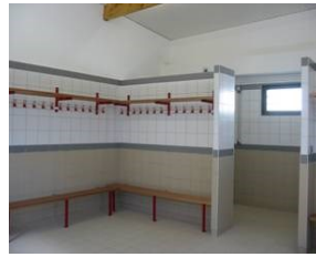
La buvette et les vestiaires de l'OL