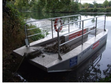
Le bateau à chaîne devenu « bateau à corde »