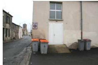
Projet d'aménagement du centre bourg