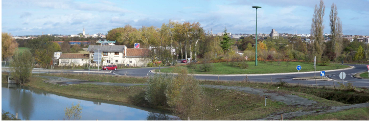
Vues lointaines sur la ville