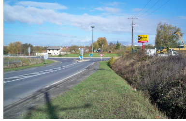
1 er plan: le giratoire