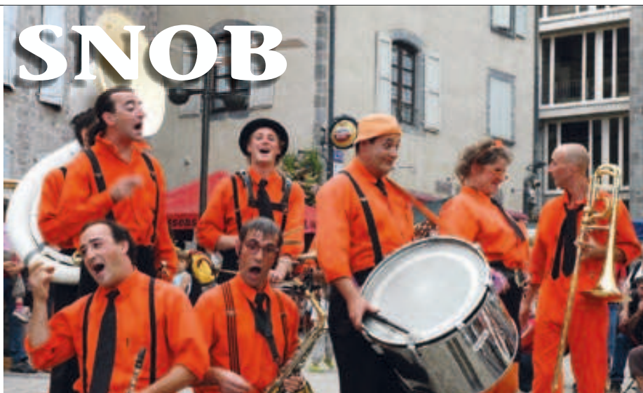
Notre joyeuse fanfare niortaise a invité tous ses copains musiciens et artistes à fêter ses 15 ans... avec nous !

Tous dans les rues le 20 juin : pour fêter ses 15 ans, la fanfare Le SNOB invite plus de 20 compagnies à investir le centre-ville. Avec un final nocturne titanesque... Prélude à la piétonnisation, cet événement préfigure aussi l'arrivée prochaine à Niort d'un Centre national des arts de la rue.