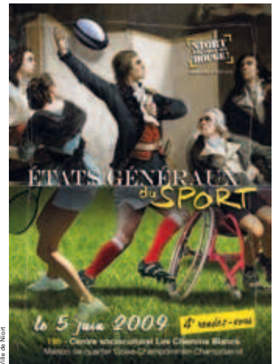
Ville de Niort

D'où il ressort une forte demande concernant la rénovation de nombreux équipements, devenus vétustes comme certains vestiaires ou certains plateaux pédagogiques. Mais aussi le besoin d'augmenter l'accessibilité à toutes les salles, que ce soit pour les personnes handicapées ou pour les non licenciés qui ne peuvent pas accéder aux créneaux des clubs. Sans oublier les attentes concernant le Pôle sport et loisirs qui vont au-delà du monde sportif.