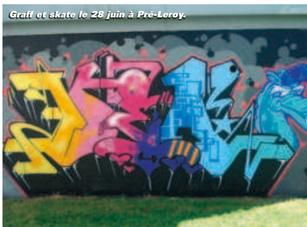
Graff et skate le 28 juin à Pré-Leroy.