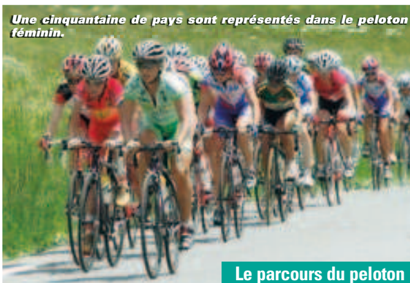
Une cinquantaine de pays sont représentés dans le peloton féminin.

nationalités, issues des cinq continents. L'épreuve sera aussi suivie par 35 télévisions qui retransmettront les grands moments de l'édition 2009. La Grande Boucle aura une forte coloration deux-sévirienne. Le départ de la course, qui ne comprend exceptionnellement que quatre étapes, sera donné à Bressuire. La deuxième reliera le Bocage à notre cité. "Je suis heureux que notre compétition fasse