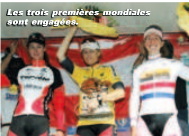
Les trois premières mondiales sont engagées.