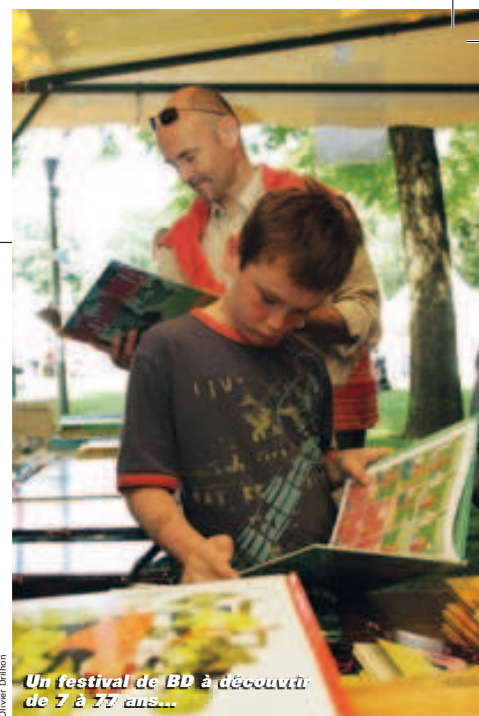
Un festival de BD à découvert de 7 à 17 ans...

petit catcheur mexicain qui se bat contre des monstres idiots. Son dernier album, La communauté , témoigne de la vie d'une communauté fondée en 1972, à partir d'entretiens avec l'un de ses fondateurs. Les œuvres de Tanquerelle seront à (re)découvrir au Belvédère du Moulin du Roc du 6 au 21 juin, tandis que le bar l'Eclusier exposera des sérigraphies de Tanguy Jossic. Autres partenaires de cette manifestation soutenue par la Ville : l'association Post-scriptum qui proposera une vente de BD d'occasion, la librairie niortaise l'Hydraxon qui comblera vos fringales d'albums sur place et la librairie de Halles qui nous invitera à rencontrer