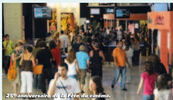
25 e anniversaire de la Fête du cinéma.

Les salles obscures nous souhaitent la bienvenue à l'occasion de la Fête du cinéma. Cette année, les tarifs d'entrée seront modiques sept jours durant. 25 e anniversaire oblige ! Comme de coutume, le prix du premier billet sera au tarif habituel. Les entrées suivantes nous coûteront 3 €. Les écrans du cinéma du Moulin du Roc et ceux du Méga CGR nous attendent. L'occasion de voir ou revoir les