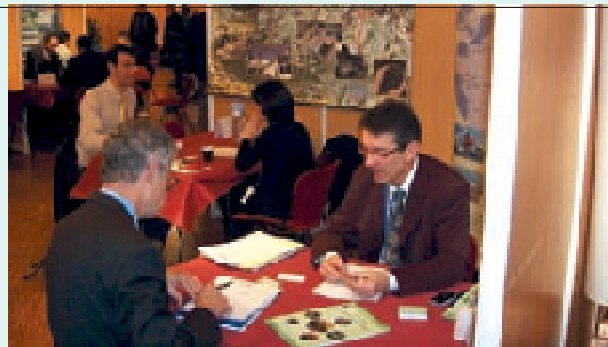
Réservé aux professionnels. Le 18 fév. de 8h à 18h30. www.siaq.fr

vous rapides). La Ville de Niort, la Communauté d'agglomération et le Conseil général seront présents ensemble sur le salon. L'occasion, pour ces collectivités territoriales de faire connaître leurs besoins en matière d'achats mais aussi d'expliquer leur fonctionnement, très réglementé par le droit public et surtout très équitable quant à l'octroi des marchés. ■