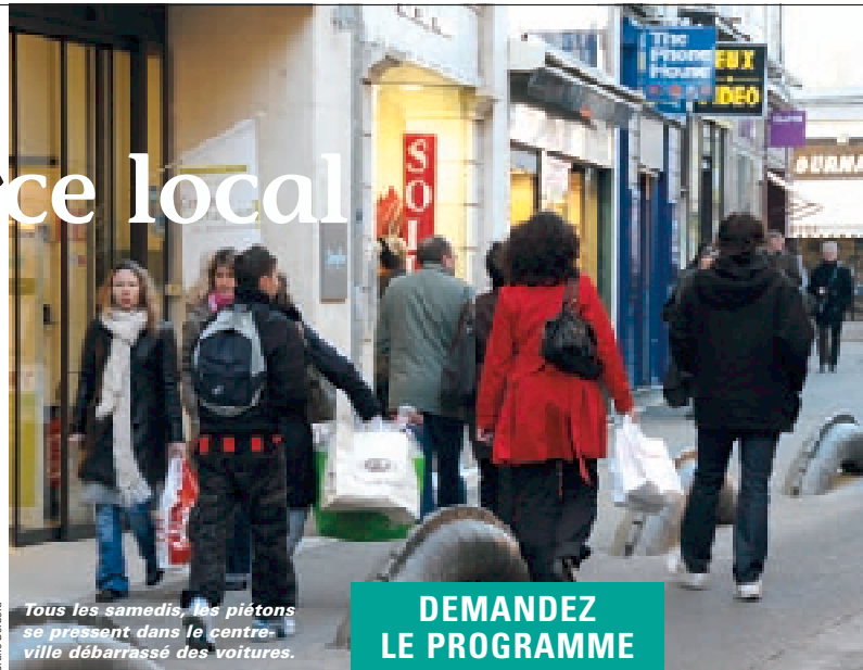
Tous les samedis, les piétons se pressent dans le centre-ville débarrassé des voitures.

Cette démarche participative, qui avait jusqu'ici pris la forme de nombreuses rencontres entre la municipalité, la CCI et l'association des Vitrines de Niort s'élargit donc à tous les consommateurs et promeneurs que nous sommes. "C'est aussi pour nous l'occasion de recueillir les avis des uns et des autres, des clients comme des commerçants. Car la piétonnisation qui a été mise en place cet été et que nous avons accompagnée d'animations, a été un vrai succès populaire. La fréquentation du centre-ville n'a pas diminué bien au contraire. Et