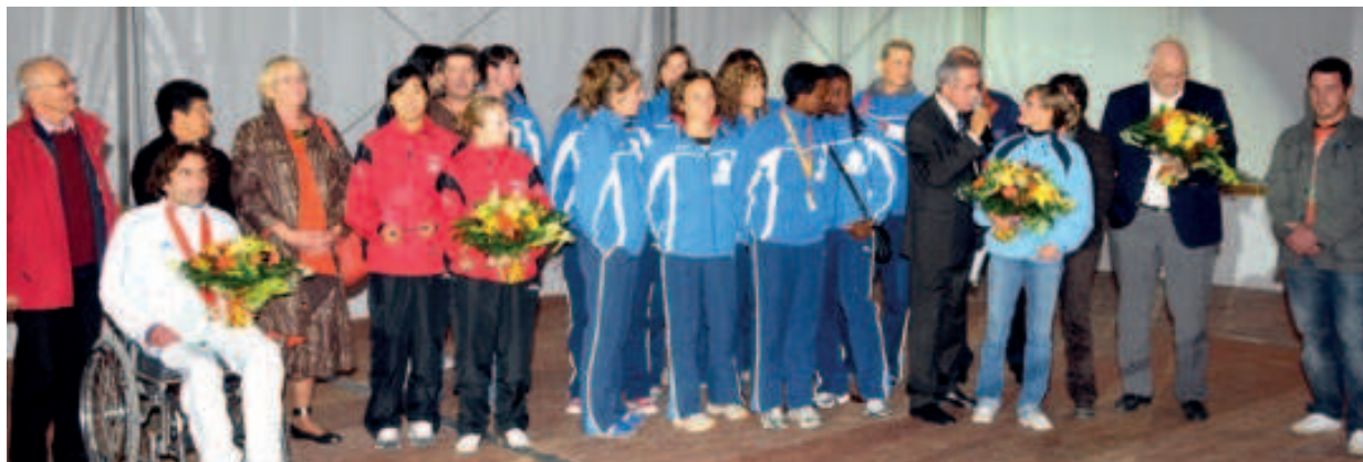
France de voltige à cheval (3è en partant de la droite).