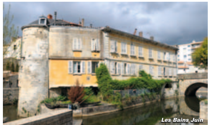
Les Bains Juifs