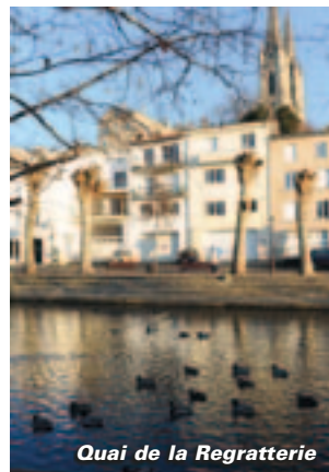
Quai de la Regratterie

En 2009, une Zone de protection du patrimoine architectural, urbain et paysager (ZPPAUP) était créée à Niort. Cette réglementation donne des instructions précises aux propriétaires qui envisagent des travaux sur un immeuble d'habitation ou de commerce. Ceci afin de préserver la valeur de notre patrimoine.