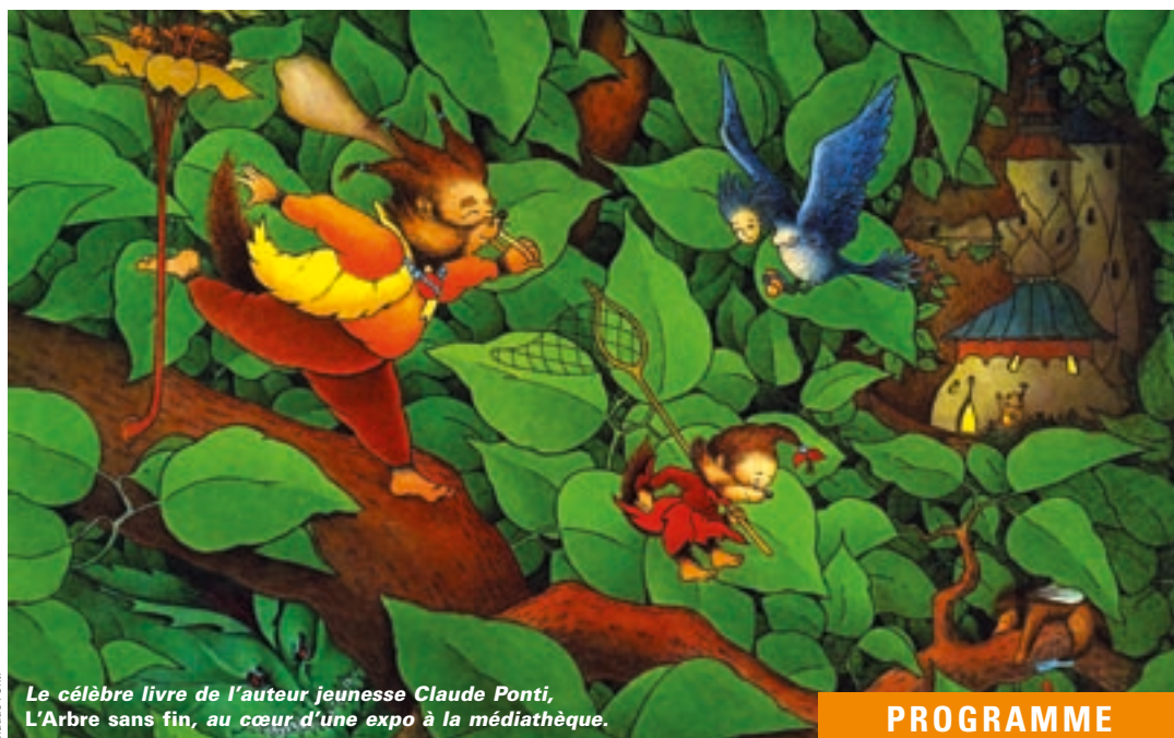
Le célèbre livre de l'auteur jeunesse Claude Ponti, L'Arbre sans fin, au cœur d'une expo à la médiathèque.

"L'arbre sans fin" : conçue et réalisée par les équipes de la médiathèque, cette exposition emprunte son nom au titre d'un célèbre album de l'auteur jeunesse Claude Ponti. Trois parcours s'y entrecroiseront : celui de l'arbre botanique, concret, où l'on découvrira les différentes essences et leurs caractéristi-