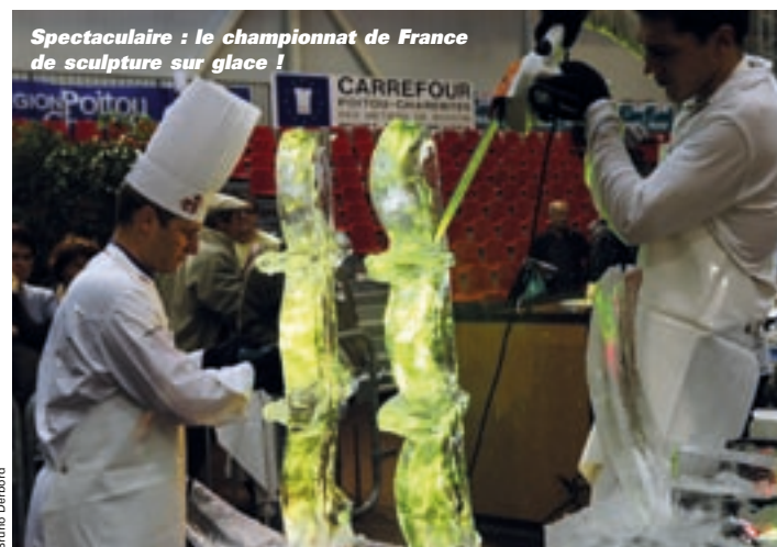
Spectaculaire : le championnat de France de sculpture sur glace !

Championnat de France de sculpture sur glace, trophée national des charcutiers traiteurs, concours des plus belles tables du Poitou-Charentes... Durant cinq jours, démonstrations et animations se succéderont. Sous le Dôme, le troisième salon régional des produits fermiers et artisanaux, Escapades gourmandes en Poitou-Charentes, réunira plus de cinquante producteurs engagés dans une démarche qualité. Des ateliers avec les chefs, les tables d'hôtes et les jeunes en formation aux métiers de bouche vous seront proposés tous les jours.