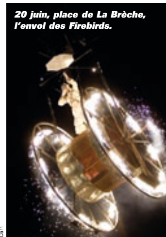
20 juin, place de La Brèche, l'envol des Firebirds.

compagnies professionnelles du spectacle... Trois champs d'action prioritaires avaient aussi été définis : les arts visuels, les musiques actuelles et les arts de la rue. Les arts visuels ont maintenant leur espace avec le Polori ; les musiques actuelles ont atteint un large public avec le festival Nouvelles scènes et cet été, les Jeudis niortais dont la fréquentation a atteint des sommets. Troisième priorité, les arts de la rue ont fait sortir de chez elles des milliers de personnes pour les