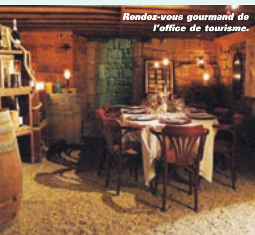
Rendez-vous gourmand de l'office de tourisme.