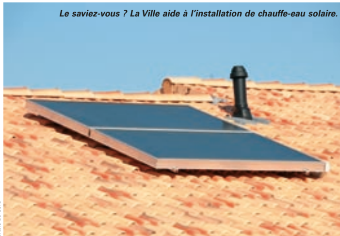
Le saviez-vous ? La Ville aide à l'installation de chauffe-eau solaire.

Le pôle régional de compétitivité des éco-industries de Poitou-Charentes, qui co-