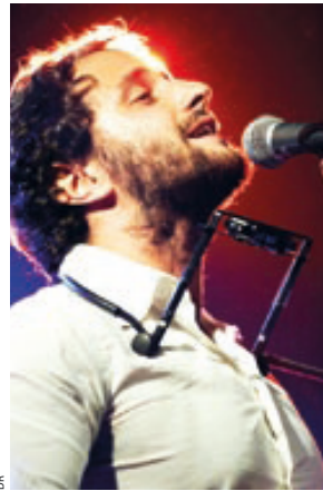
Bense sera avec Merlot au Camji.

Créée il y a 8 ans par l'agence le Loup blanc, le festival Nouvelle(s) scène(s), qui fédère les acteurs