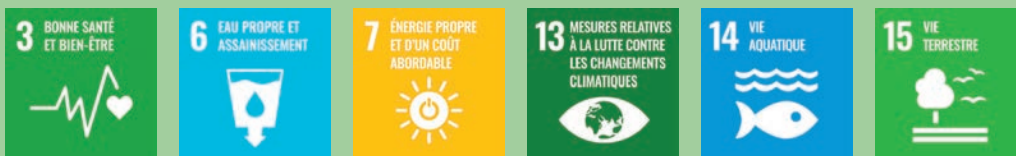
En lien avec les objectifs de développement durable