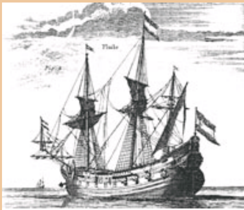
DR Québec a été fondée par le charentais Samuel de Champlain.

C e spectacle est aussi l'occasion de réviser une page d'histoire. Le 3 juillet 1608, Samuel de Champlain, cartographe du roi Henri IV, né à Brouage, en Charente-Maritime, vers 1567, débarque au lieu-dit Québec où il établit un comptoir de traite de fourrures. L'endroit choisit semble idéal. Du haut du promontoire, le cap Diamant, il est facile d'observer et de contrôler les allées et venues sur le fleuve Saint-Laurent. Champlain y fait construire une « abitation » de bois qui sert à la fois de résidence, de fort et de magasin. Après avoir effectué d'autres voyages, il meurt à Québec en 1635. Quatre cents ans ont passé depuis cette découverte et aujourd'hui, des deux côtés