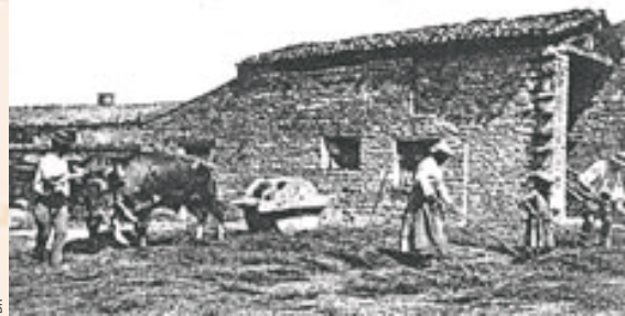
La ferme de Chey autrefois.

vice-présidente. Un spectacle racontant la vie de la ferme, du Moyen Âge à 1914, nous permettait ainsi de faire l'inventaire de tous nos costumes anciens, mais aussi de fédérer les membres de l'association et tous nos ateliers autour d'un nouveau projet." Le choix du son et lumière s'est tout de suite imposé.