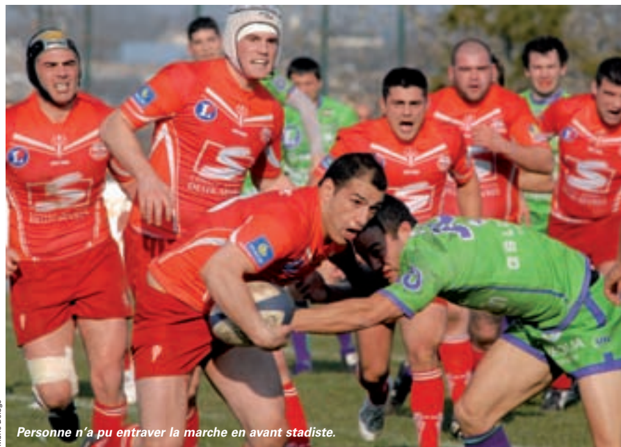
Personne n'a pu entraver la marche en avant stadiste.