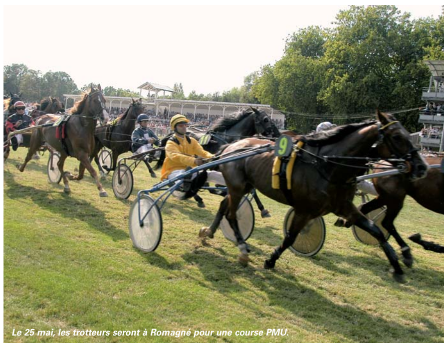
Le 25 mai, les trotteurs seront à Romagné pour une course PMU.

Michel Moulin. Bien sûr, l'entrée sera toujours gratuite pour les enfants et les femmes. Le 25 mai, les petits pourront faire du manège, des tours de poney ou être maquillés. Des peintres œuvreront au bord de la piste, leurs tableaux ache-