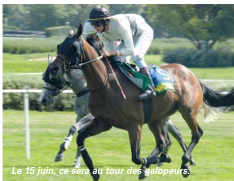
Le 15 juin, ce sera au tour des galopeurs.

Michel Moulin. L'an passé, sur l'ensemble des quatre réunions, nous avons accueilli environ 7 500 personnes. Cela représente une augmentation de la fréquentation de 2,50 %. Celle-