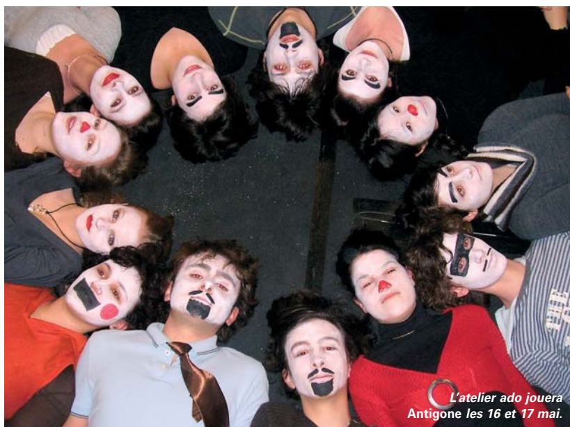
L'atelier ado jouera Antigone les 16 et 17 mai.

Rens. 05 49 73 53 17 ou www.theatre-chaloupe.com