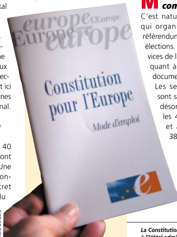
La Constitution est à disposition à l'Hôtel administratif communal.

La non-ratification du traité constitutionnel par l'un au moins des Etats membres inter-