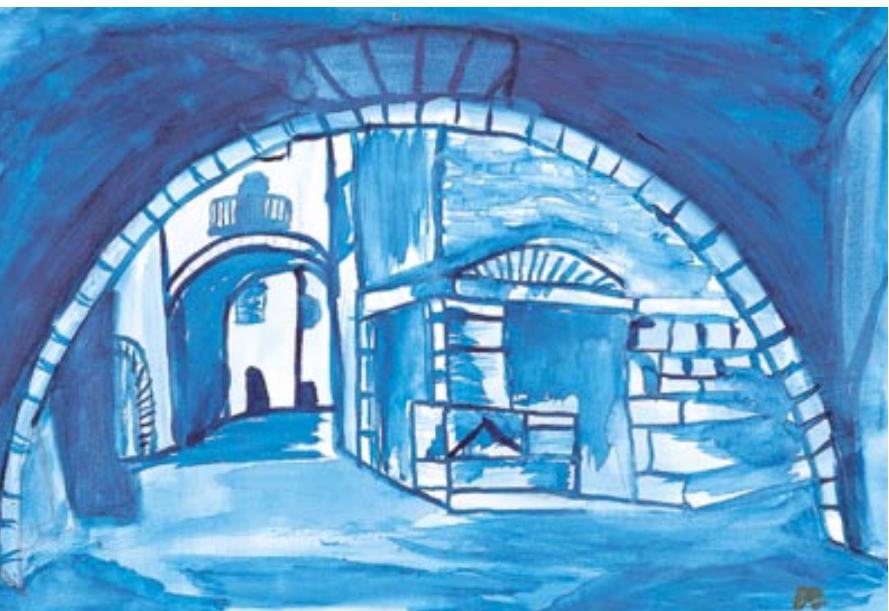
Une des peintures présentées en mairie.

matique à la Maison d'arrêt. Dans cet univers carcéral où elle intervient depuis deux ans, en plus de ses heures de cours au lycée,