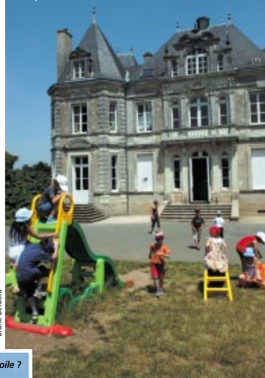
Vous préférez le Château de Chantemerle...