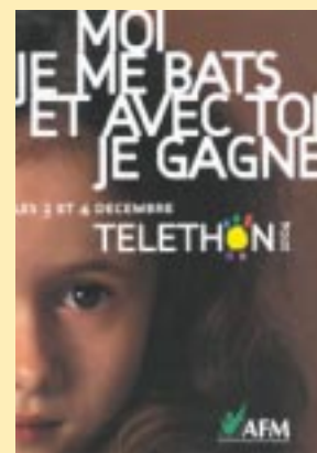
Le 4 décembre, n'oubliez pas le 36 37 du Téléthon.

Dans le cadre de la XVIII e édition du Téléthon, l'ASPTT Niort organise une journée sportive de mobilisation pour lutter contre les maladies génétiques, le samedi 4 décembre à partir de 10h à son siège, sur le stade de Saint-Liguaire. A cette occasion, un fil rouge, rythmé par une course à pied et une marche, se déroulera toute la journée, sans interruption, sur la piste d'athlétisme de 11h à 19h. Des animations sportives et des jeux seront proposés au public avec du tennis de table, de la gymnastique, du football ou encore de la pétanque en triplette. Les plus petits, quant à eux, pourront s'en donner à cœur joie avec l'atelier maquillage, le lâcher de ballons, le trampoline et l'incontournable pêche aux canards... Et pour marquer l'évènement, une