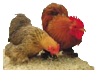
La Bantam de Pékin

La Société des aviculteurs des Deux-Sèvres organise les 22 et 23 janvier, au parc des expos à Noron, sous les halles de la Sèvre et de Galuchet, la XVII e exposition nationale d'aviculture. Niort, 5 e référence sur le plan national, a le privilège d'accueillir un événement de cette ampleur grâce notamment à la qualité de ses infrastructures. Pour cette occasion, gallinacées, palmipèdes et tout ce que les basses-cours comptent comme