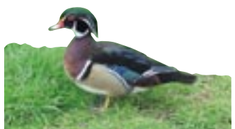
Le canard Carolin

Le 22 janvier de 9h à 21h et le 23 janvier de 9h à 18h. Rens. : Société des aviculteurs des Deux-Sèvres, J. Barraud, tél. 05 49 25 57 71.