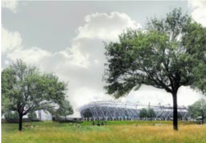
C'est le projet de Borja Huidobro et du cabinet A5 architectes associés qui a été retenu pour le nouveau stade avenue de Limoges. A la fois pour ses qualités architecturales et pour sa vocation paysagère forte.

A côté du stade, l'Espace acrobatique permettra à tous les adeptes des sports de grimpe et d'acrobatie de s'exercer, en salle ou à l'extérieur.