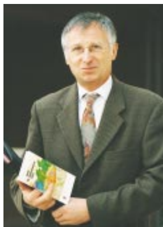
"Les tarifs niortais étaient largement en dessous des prix du marché."

JM : Les tarifs niortais étaient jusqu'ici largement en dessous des prix du marché – en comparaison notamment avec les villes de la région – et nous devons les réajuster d'autant