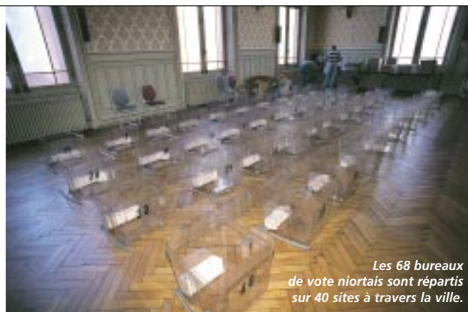
Les 68 bureaux de vote niortais sont répartis sur 40 sites à travers la ville.