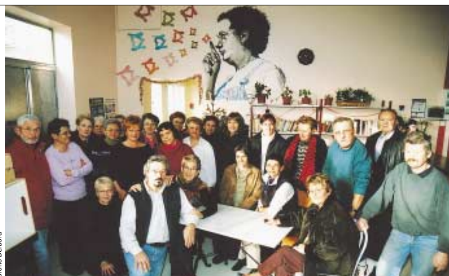
Les bénévoles de l'association de Coluche se mobilisent pour répondre à la demande toujours plus importante.