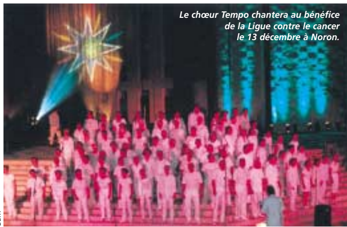
Le chœur Tempo chantera au bénéfice de la Ligue contre le cancer le 13 décembre à Noron.

Le peintre Fabrice Penaux et le chœur Tempo se mobilisent ce mois-ci aux côtés de la Ligue contre le cancer et de ses bénévoles. Pour se battre sur tous les fronts de la maladie.