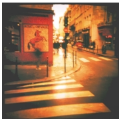
NEW WORK - MAX PAM