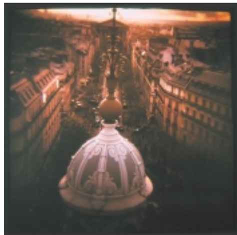
NEW WORK - MAX PAM

Renseignements auprès de l'association Pour l'instant au 05 49 24 35 44.