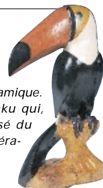
Eric Chauvet - PRMA