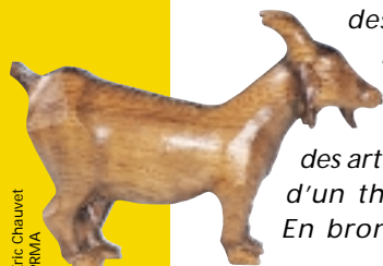
Eric Chauvet - PRMA

■ Renseignements dans les MCPT, les MCC ou auprès de Vidéo pour tous, au 05 49 17 18 48.