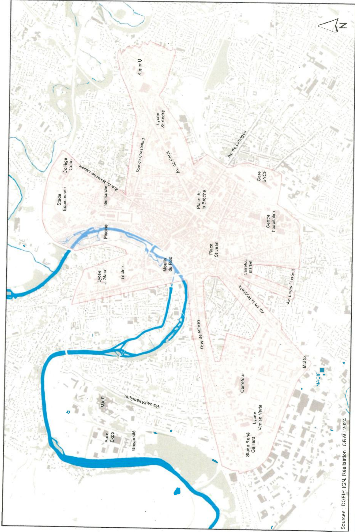
Restriktion des horaires pour la vente à emporter de boissons alcoolisées ou alcooliques 0 0,5 1 2 Km