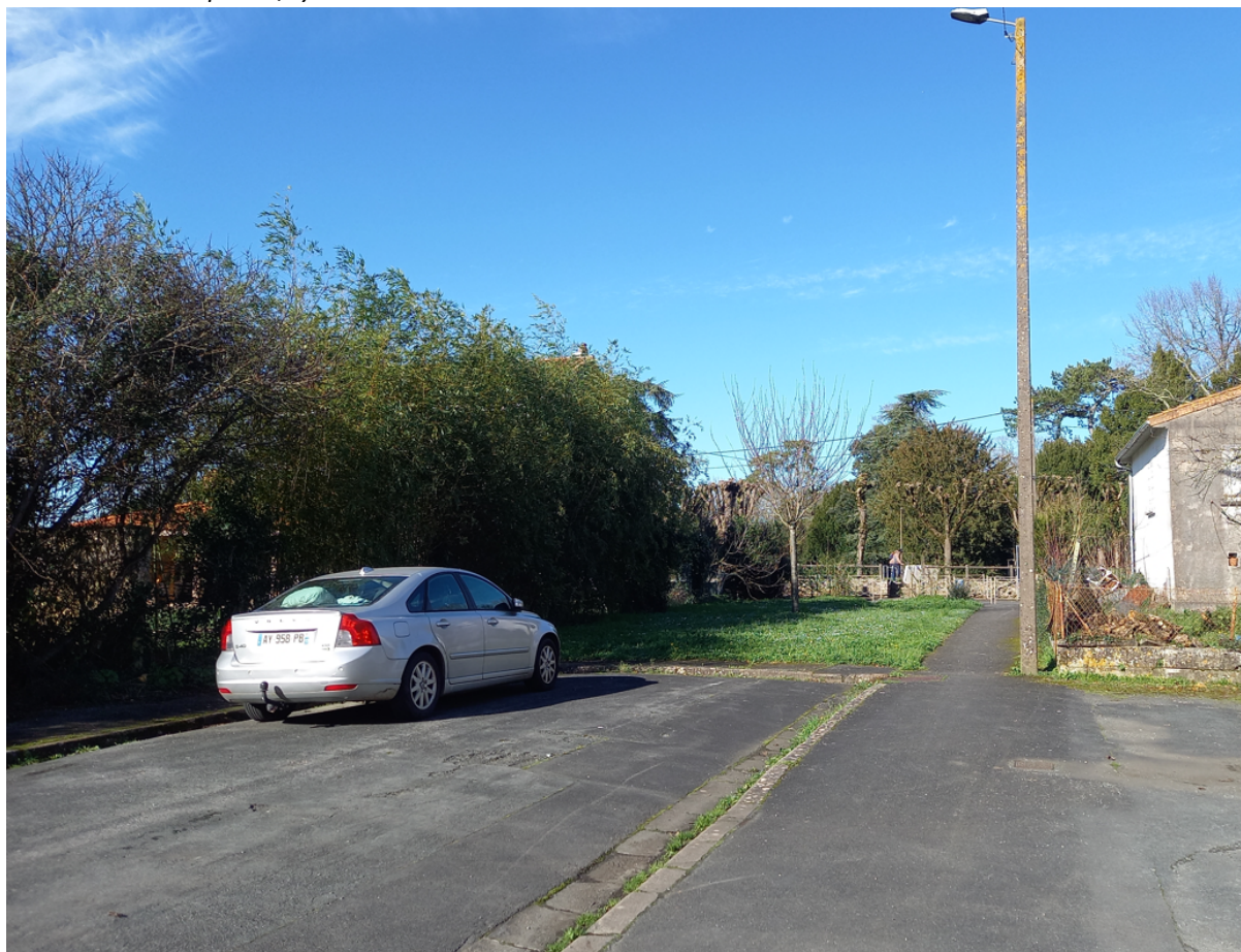
Photo de la chaussée et des bordures