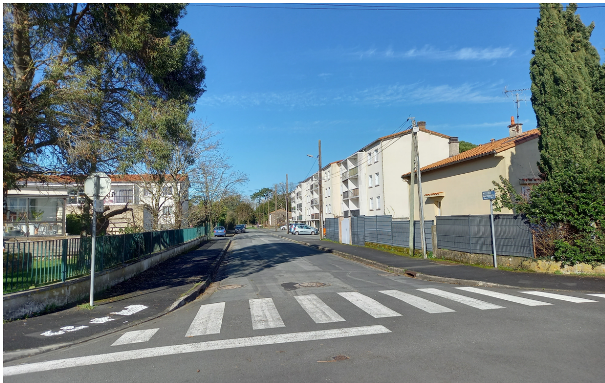
Photo de la chaussée à l'entrée de la rue