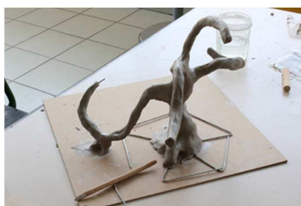
Atelier art-thérapie - sculptures de rocaille