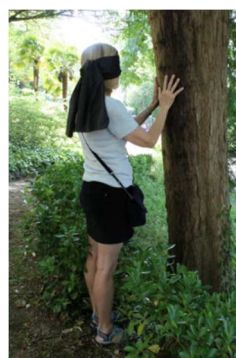
Atelier découverte à l'aveugle