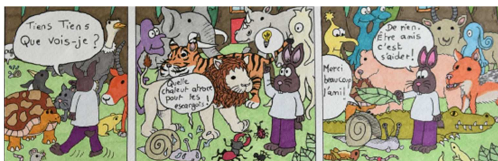
Extraits de planches BD « Citoyenneté et handicap » © Direction de l'Education