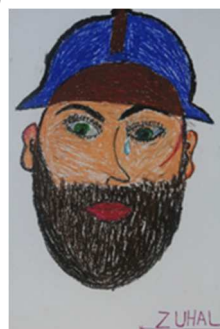
Atelier d'art-thérapie Lycée Gaston Barré