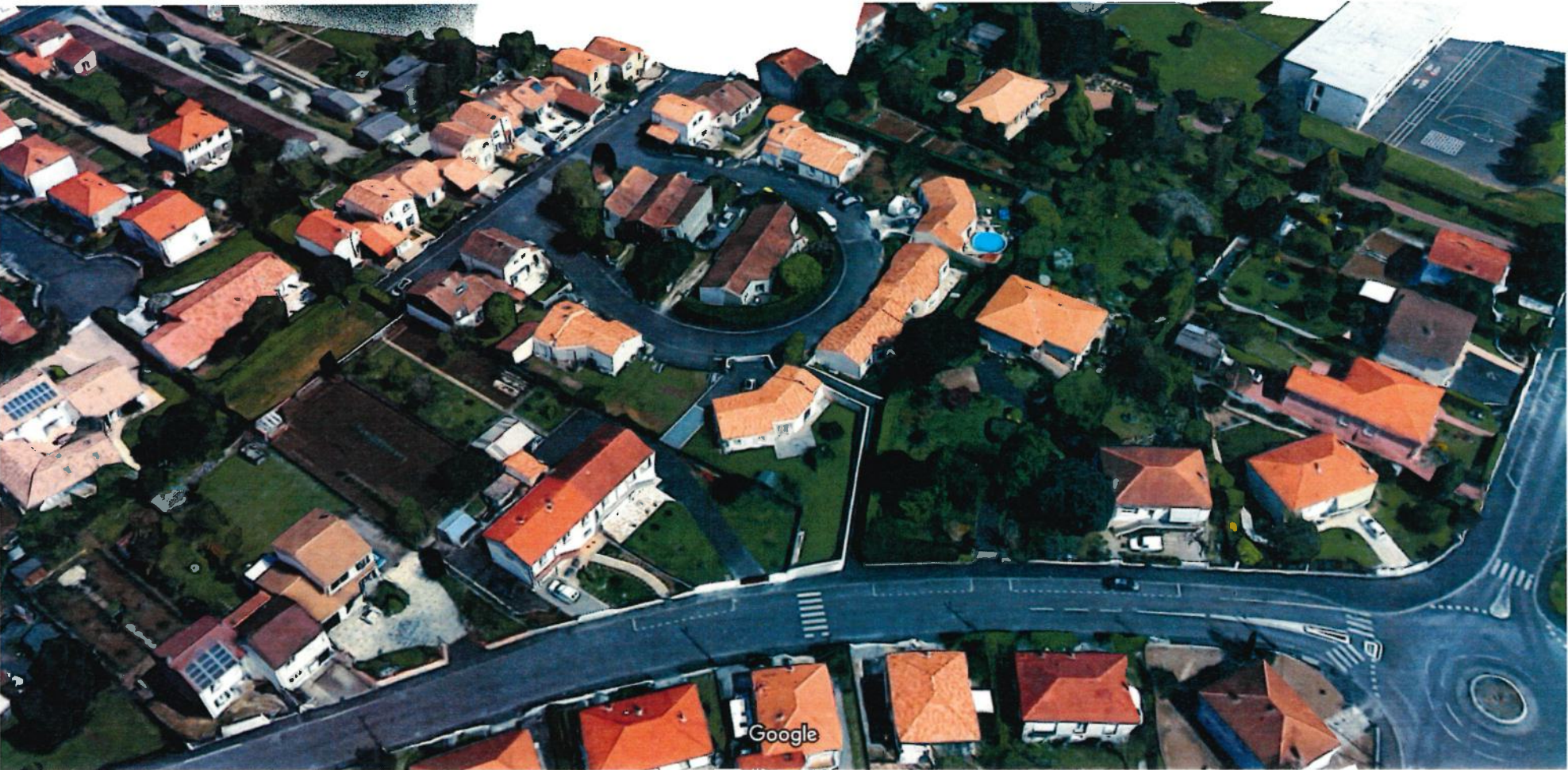
Données cartographiques ©2018 Google 10 m