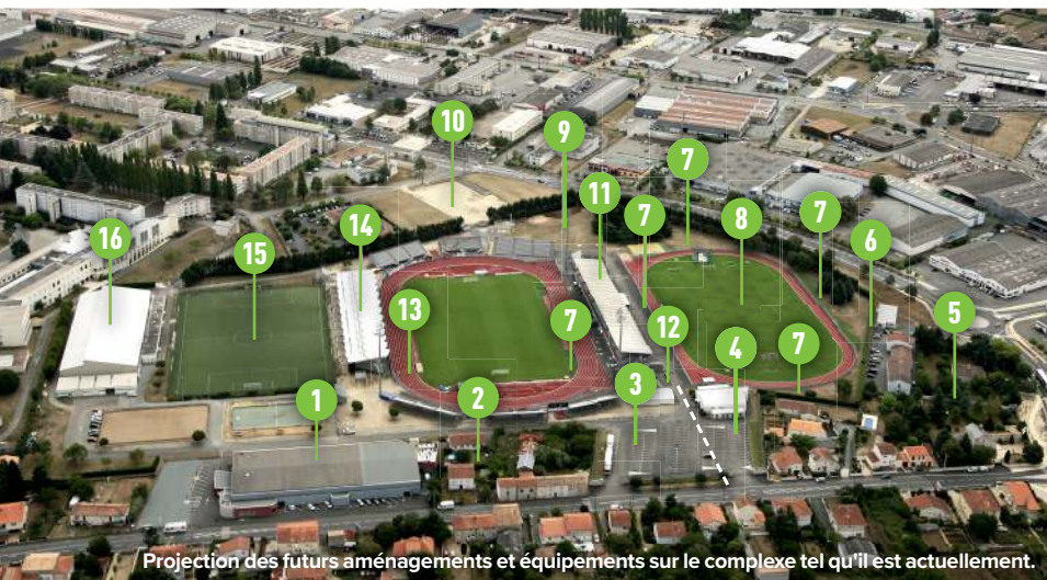
Projection des futurs aménagements et équipements sur le complexe tel qu'il est actuellement.

Les grandes lignes du projet d'aménagement du complexe sportif de la Venise verte sont désormais connues.