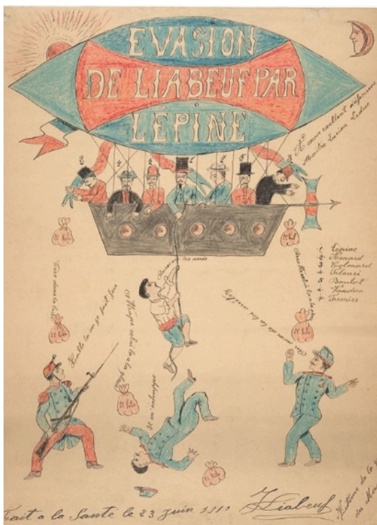
© Jean-Jacques Liabeuf. « Évasion de Liabeuf par Lépine », 1910

Meubles miniatures, peaux et cornes d'animaux modelées, jeu de dames ou de cartes, maquettes, coquillages, calebasses et noix de coco ciselées et décorées... Autant de créations artisanales surprenantes, autant de formes permettant d'alléger les conditions d'incarcération.